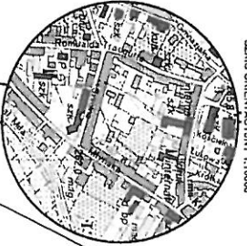
SZCZEGÓLNA ORIENTACYJNY 1:10000

Wykonał 20.02.2024r. mgr inż. A. Matkowski Nr upr. 18360