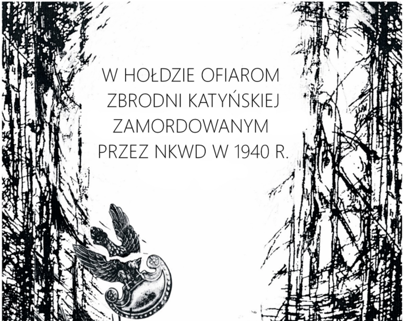
tablica pamiątkowa o wymiarach 100 cm x 80 cm