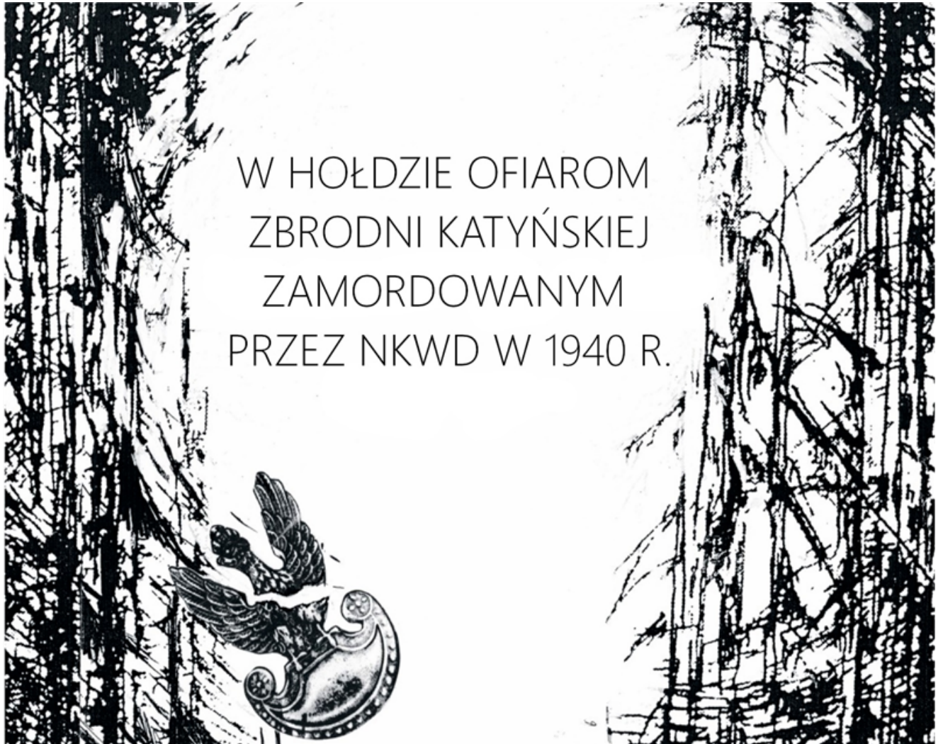
tablica pamiątkowa o wymiarach 100 cm x 80 cm

Załącznik Nr 1 do uchwały Nr ..... Rady Miejskiej w Prudniku z dnia 27 marca 2023 r.