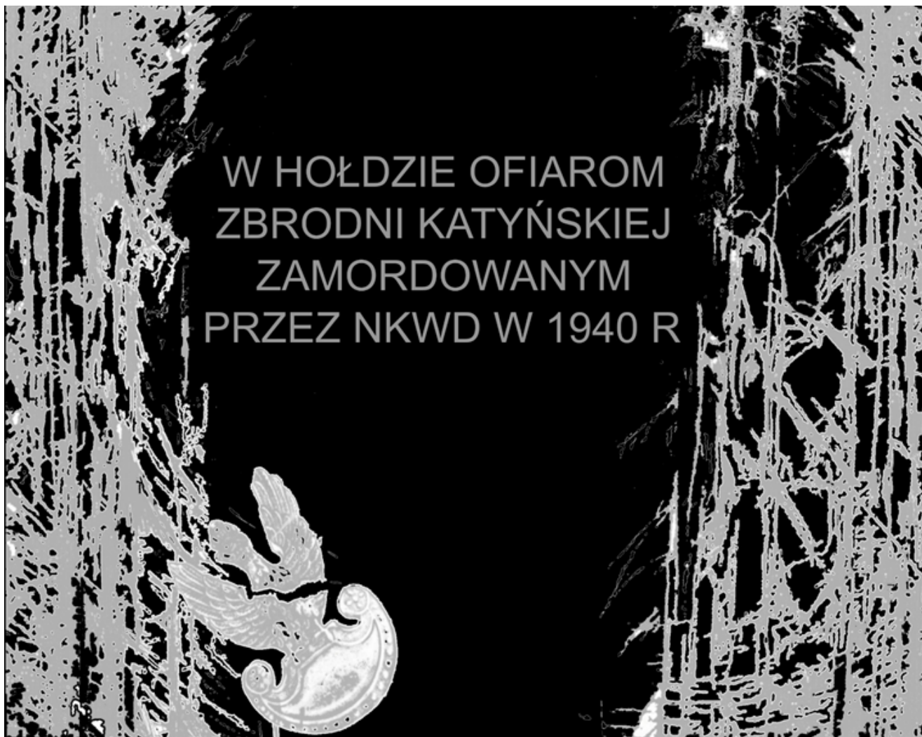
tablica pamiątkowa o wymiarach 100 cm x 80 cm

Załącznik Nr 1 do uchwały Nr LXXVII/1179/2023 Rady Miejskiej w Prudniku z dnia 27 marca 2023 r.