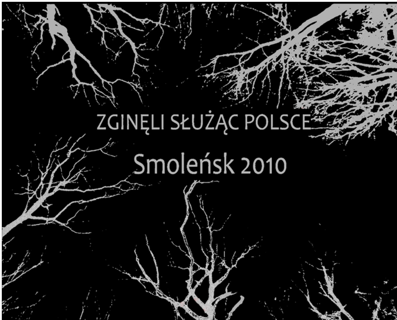
tablica pamiątkowa o wymiarach 100 cm x 80 cm

Załącznik Nr 1 do uchwały Nr LXXVII/1180/2023 Rady Miejskiej w Prudniku z dnia 27 marca 2023 r.